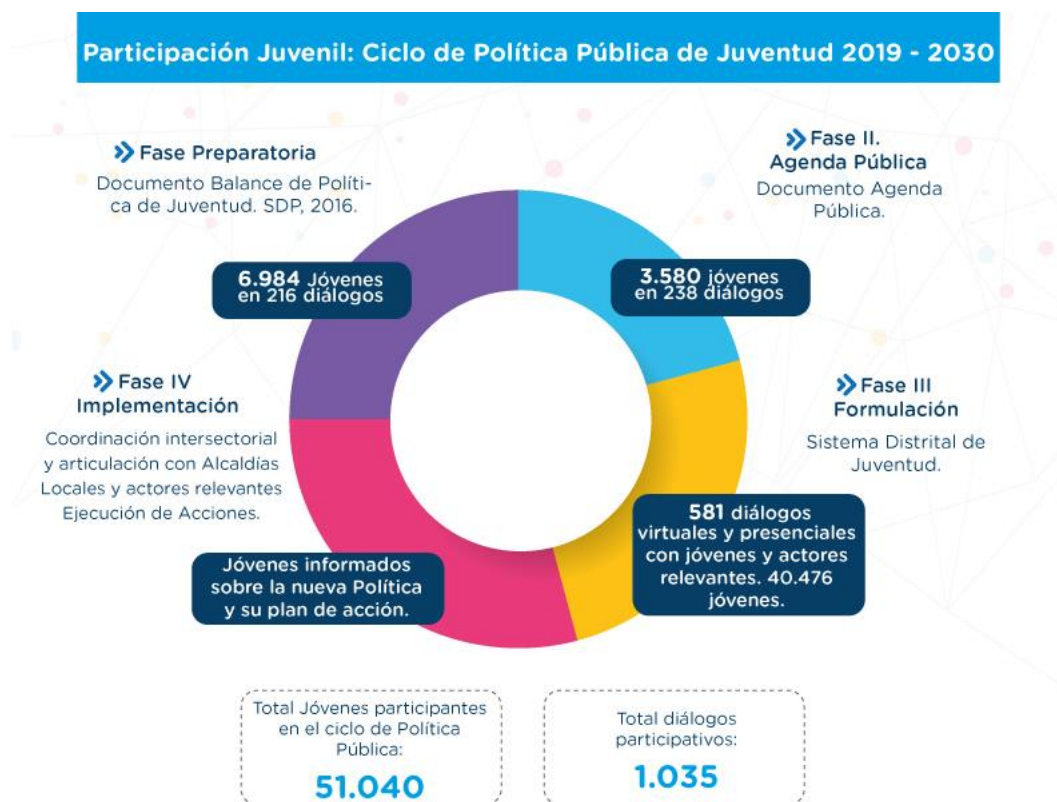
Figura 5 Participación Juvenil en el Ciclo de Política Pública de Juventud 2019 – 2030.

En el marco de la construcción de la Política en su ciclo de formulación, la estrategia de participación buscó contar con una amplia incidencia en cada una de sus fases: Preparatoria, Agenda Pública y Formulación.