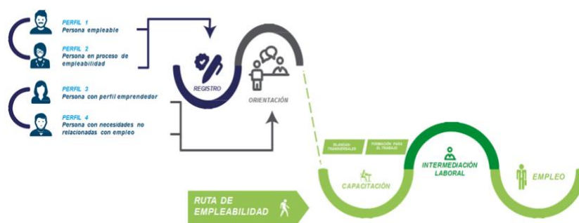
Figura 1. Ruta De Empleabilidad

La Ruta de empleabilidad operada a través de la Agencia cuenta los procedimientos y tiempos para que la población culmine cada una de las etapas de la ruta de empleo, desde la presentación e inscripción hasta la remisión a vacantes dispuestas por el sector productivo, que se realizan bajo una programación especial y son publicadas y difundidas a través de la página www.bogotatrabaja.gov.co de la Secretaria de Desarrollo Económico (SDDE).