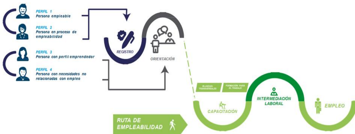
Figura 1. Ruta De Empleabilidad

De esta forma, a través de la Ruta de Empleabilidad de la Agencia de Gestión y Colocación de Empleo del Distrito “Bogotá Trabaja” todas las personas pueden acceder a servicios de orientación ocupacional, intermediación laboral y capacitación para el desarrollo de competencias, cumpliendo con las siguientes etapas: