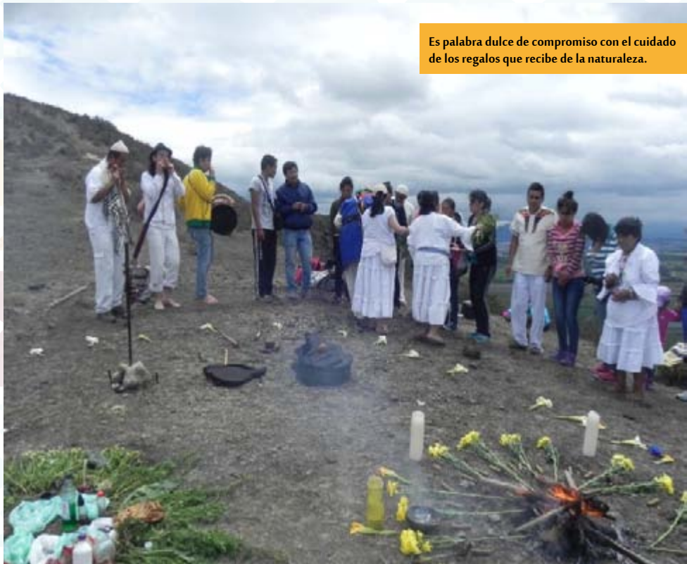
Es palabra dulce de compromiso con el cuidado de los regalos que recibe de la naturaleza.

la oficina está el ahorro de energía eléctrica, manteniendo las luces apagadas en los espacios que no estén en uso, permanecer desenchufadas la toma de los aparatos que no estén en uso. Hablar de uso eficiente de la energía es para los Muiscas hablar de respeto a la madre tierra, mostrando la adoración a uno de nuestros elementales. Por el bien recibido. Es palabra dulce de compromiso con el cuidado de los regalos que recibe de la naturaleza, es el compromiso de explorar fuentes de energías no convencionales que respeten y cuiden el ambiente, amigables con el espacio que cohabitamos con las demás especies.