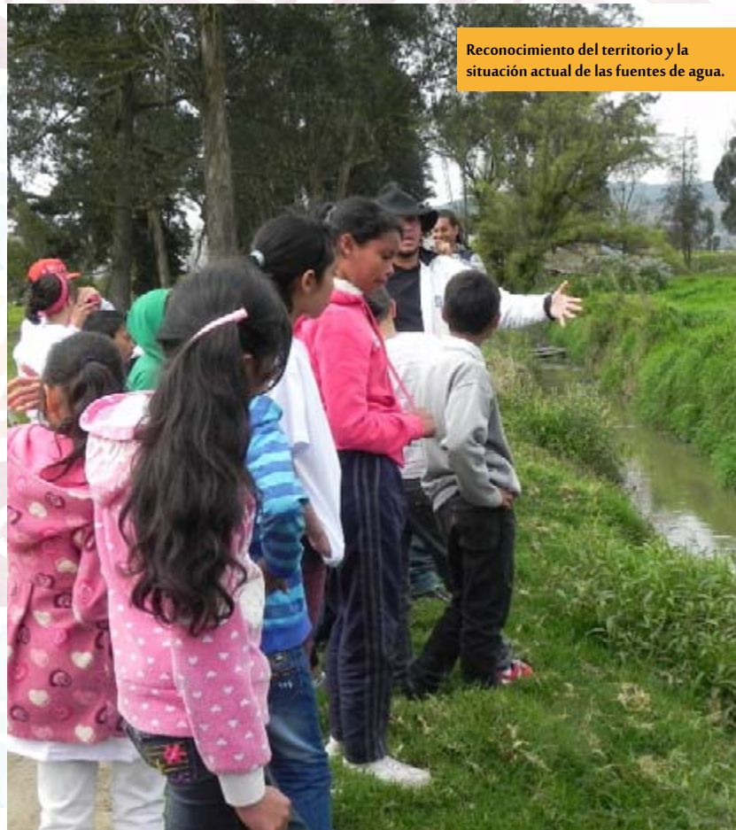
Reconocimiento del territorio y la situación actual de las fuentes de agua.

Educar a los niños para que no la desperdicien y enseñarles como es el origen de esta. Ciclo del agua. Con el fin de concientizarlos y educarlos.