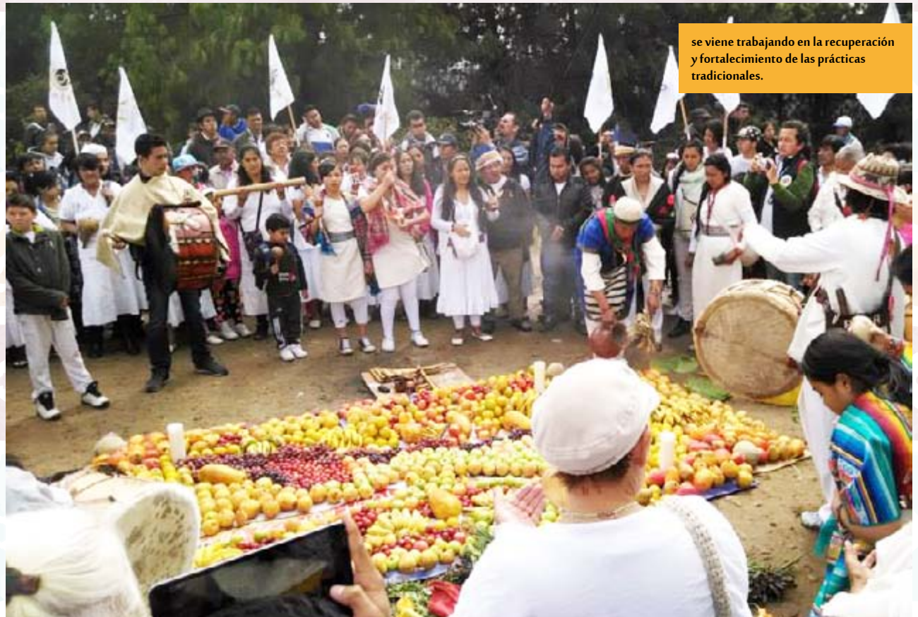
se viene trabajando en la recuperación y fortalecimiento de las prácticas tradicionales.

el territorio, apoyándose también en otras dinámicas propias, como el desarrollo de la espiritualidad y la apropiación del derecho propio, donde destacan como principios colectivos: el cuidado del entorno, de la naturaleza y sus recursos, el rescate de los saberes ancestrales reafirmando la identidad y el respeto de sus particularidades, elementos constitutivos de la ley de origen, que toman gran importancia en la formulación y ejecución de acciones en favor del rescate del territorio de Bosa, sus aguas, sus suelos, sus frutos y su legado ancestral.