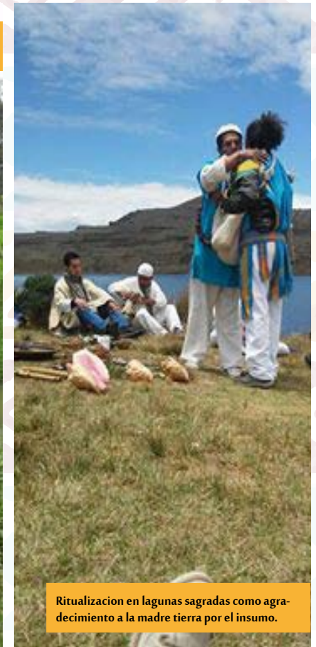
Ritualización en lagunas sagradas como agradecimiento a la madre tierra por el insumo.