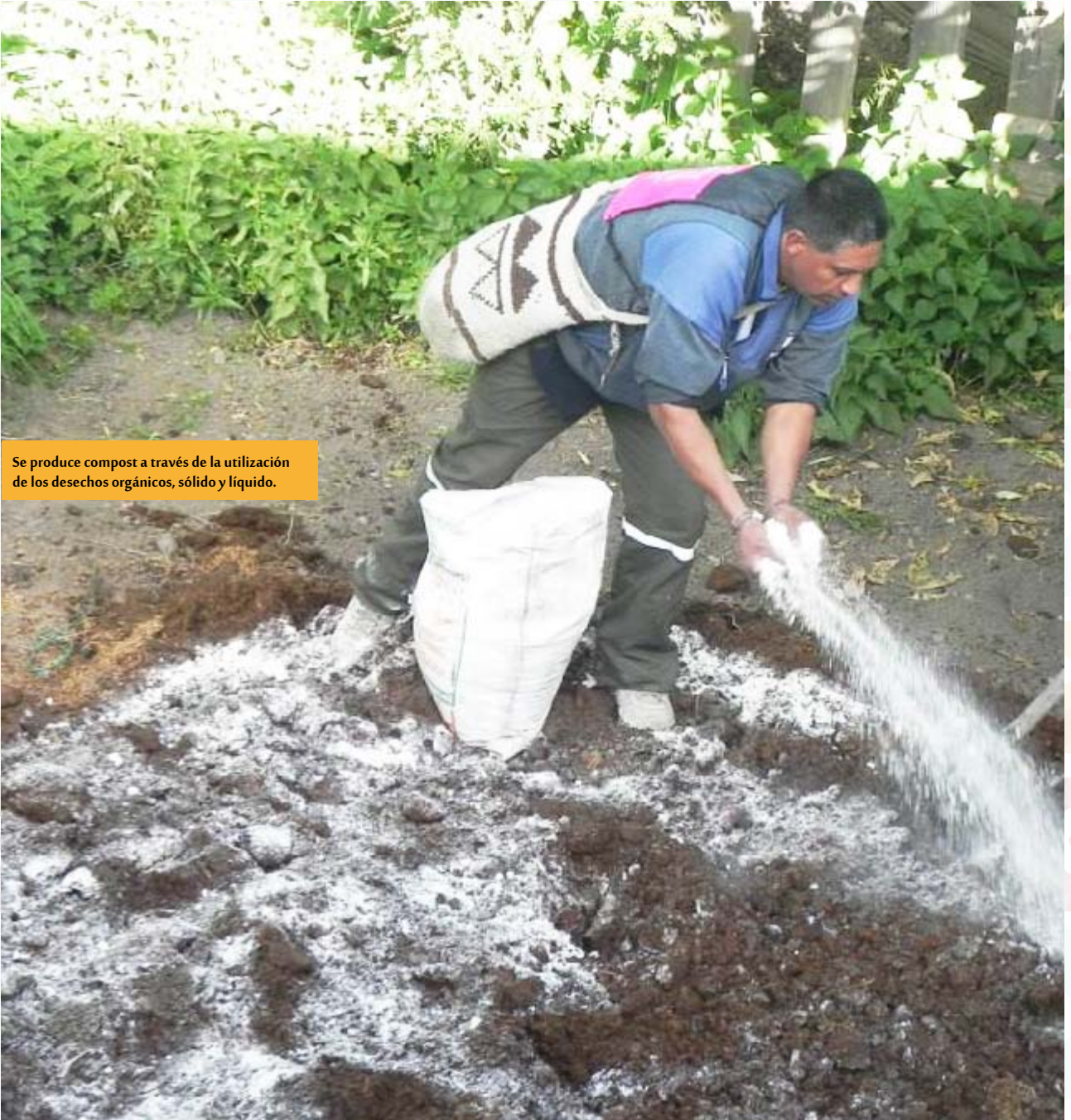
Se produce compost a través de la utilización de los desechos orgánicos, sólido y líquido.