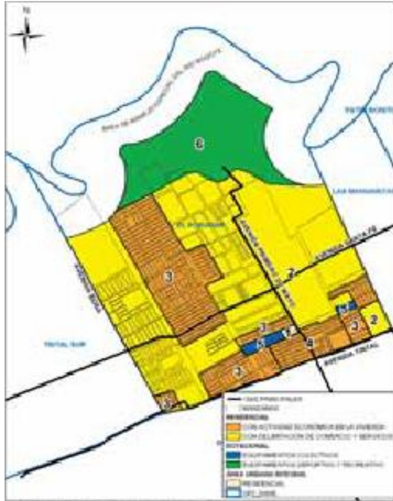
Mapa de Uso del Suelo. Escala 1:500.