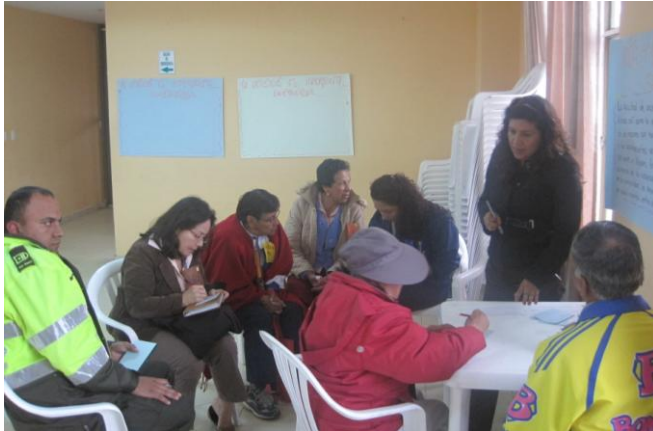
Mesas de trabajo por núcleo problemático 18 de agosto de 2010.