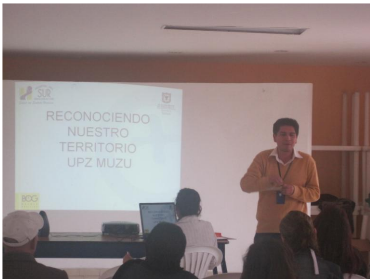
Foto tomada en la mesa de calidad de vida que se llevo a cabo el 18 de agosto de 2010 en el salón comunal Alcalá Muzú.